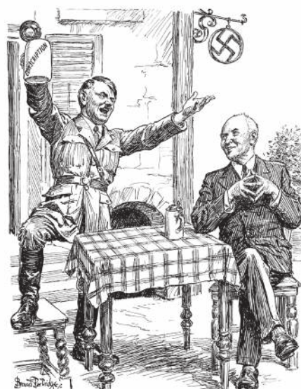
PROSIT! HERR HITLER. "THE MORE WE ARM TOGETHER THE PEACEFULER WE'LL BE!" SIR JOHN SIMON. "WELL—ER—UP TO A CERTAIN POINT—AND IN CERTAIN CASES—PROVISIONALLY—PERHAPS."

Herr Hitler : « Plus nous nous armons ensemble, plus nous serons en paix ! » Sir John Simon : « Et bien – euh – jusqu'à un certain point – et dans certains cas – provisoirement – peut-être. »